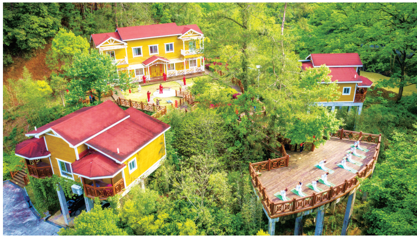
桃源睡眠森林康养基地