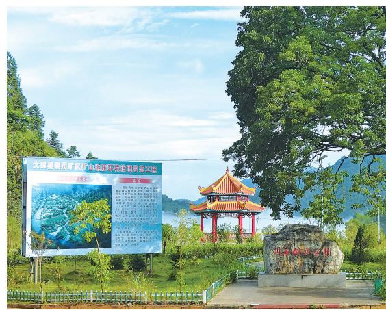
山川矿山公园