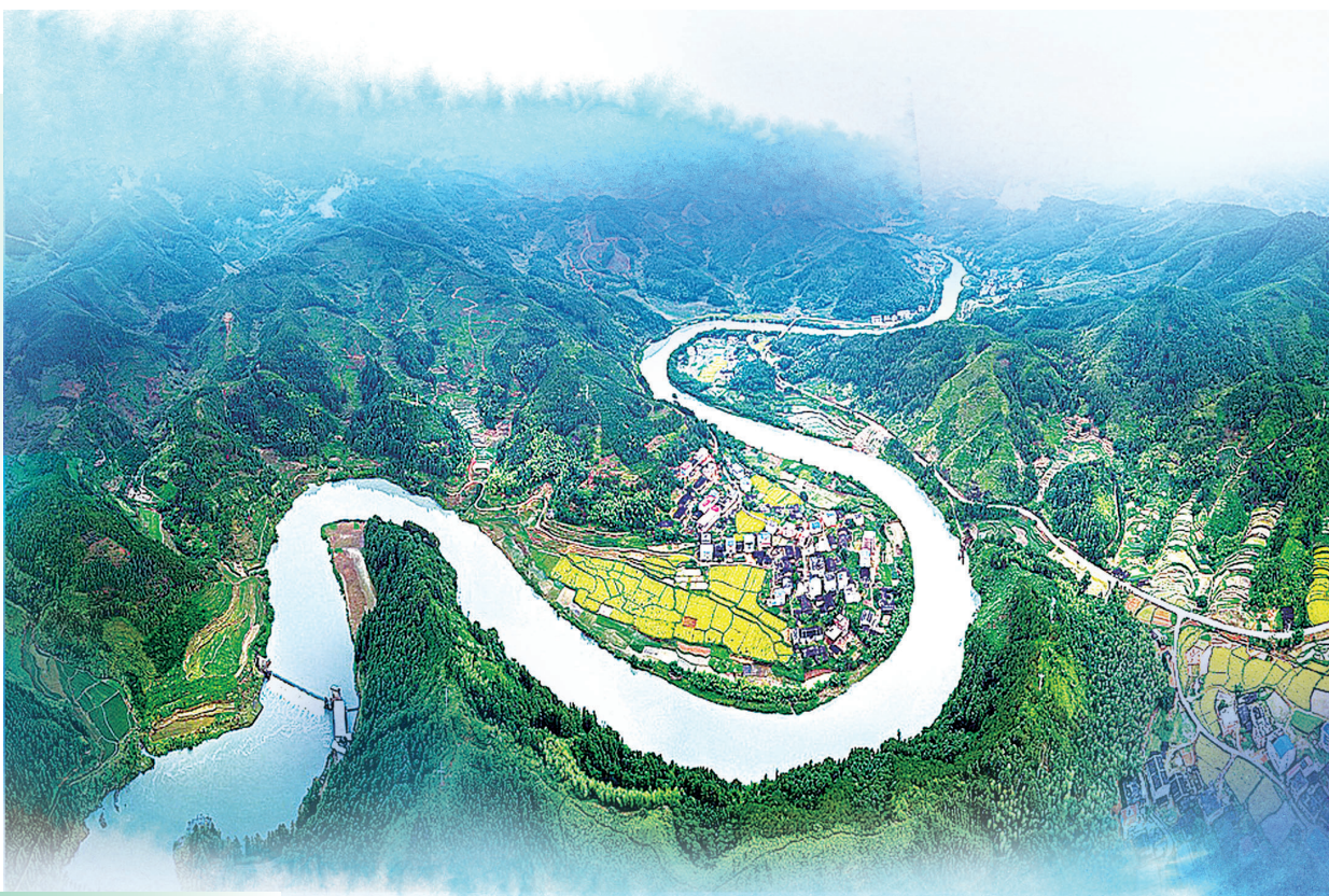
◀ 一河清水的文江溪 ▼ 青山环抱着的大田县城饮用水源地坑口水库

近年来,大田县始终践行习近平同志提出的“青山绿水是无价之宝”重要论断,深入打好污染防治攻坚战,推广生态综合管护模式,狠抓生态环境问题整改,着力构建绿色发展格局,不断擦亮绿色发展的生态“底色”,森林覆盖率达73.43%,被评为“中国天然氧吧”、首批全国生态旅游胜地、中国森林旅游美景推广地,绘好新时代“富春山居图”,奋力打造生态文明建设的“展示窗口”。