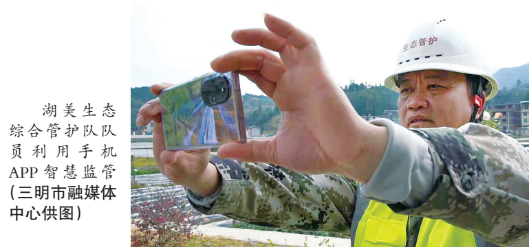
湖美生态综合管护队队员利用手机APP智慧监管

青山绿水是无价之宝。东风农场年产红菇1500公斤,以每公斤超3000元的价格,可谓一味山珍难求。这里拥有芙蓉李、雷竹笋、玉米等瓜果蔬菜盛名远扬,引来乡村旅游热潮。这里还拥有了一股日出水量2000吨的冷泉,以优质水质,开发了纯净水项目。