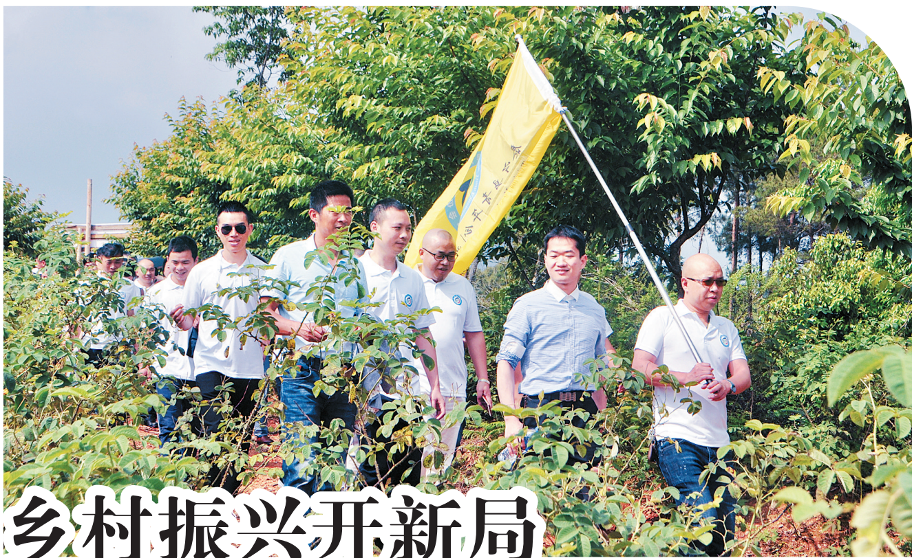
泰宁县青年创业协会走访会员企业

5月24日,在泰宁县青年人才驿站,青年创业者们正在热烈地座谈交流。泰宁县地处山区,长期以来人才外流,如何让年轻人返乡留下来是长期探索破解的难题之一。基于此,泰宁县于2020年成立了第一家青年人才驿站,170余名年轻人在这里汇聚。