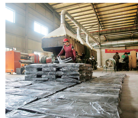
华邦橡胶工人正在打包成品