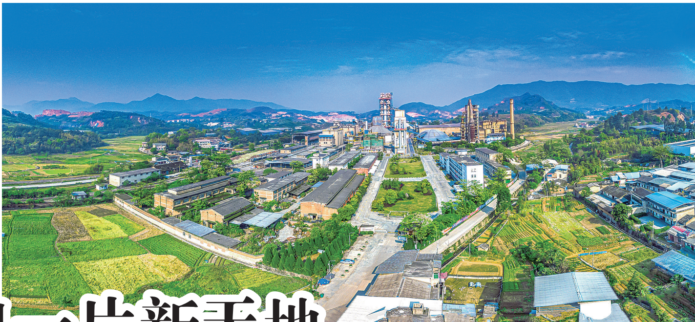
福建水泥一角

项目是高质量发展的重要支撑。新的一年,曹远镇认真贯彻落实“深学争优、敢为争先、实干争效”行动部署和“抓重大项目,促高质量发展”工作要求,一开年就拉满弓、绷紧弦,盯紧项目建设、企业培育,全力投入抓项目、全力以拼经济,奋力实现一季度“开门红”“开门红”,为完成全年目标任务开好局、起好步。