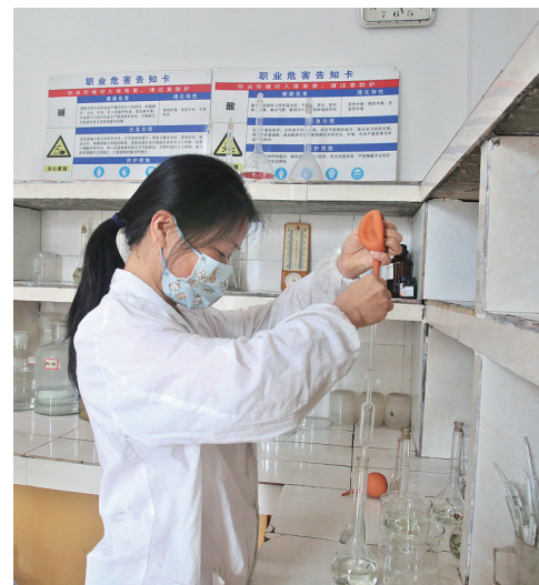
谋成水泥科研人员检测产品质量

坚持项目为王,高质量谋划、高效率开工、高标准投产一体推进,曹远镇兴起项目建设新热潮。