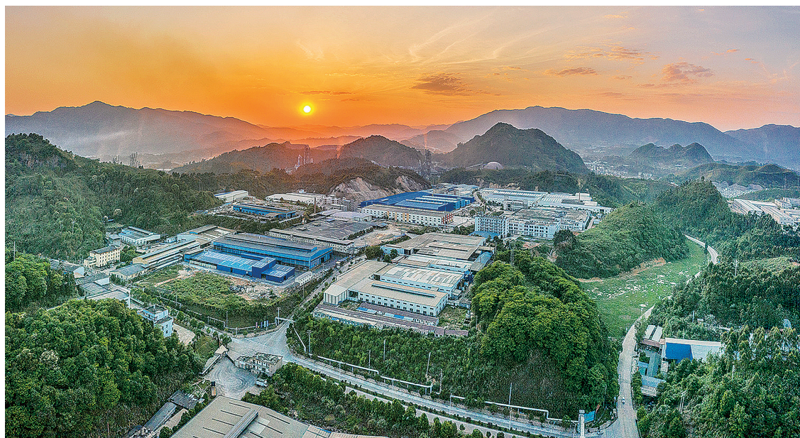
曹远大兴工业园区一角

奋楫扬帆正当时。曹远镇锚定奋斗目标,在新一轮拼经济热潮中,千帆竞发、不负春光,接续书写工业强镇高质量发展新篇章。