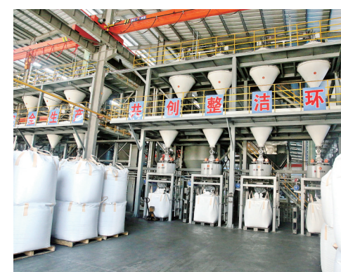
整洁的永久硅碳企业车间