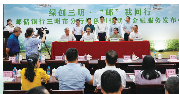
2021年4月13日，邮储银行三明市分行举办绿创三明“邮”我同行暨绿色创业就业金融服务发布会，与共青团三明市委员会、三明市工商联、三明市国有融资担保有限公司等单位签署战略合作协议。

奋进新征程，建功新时代。走过十五年，邮储银行三明市分行不改初心，砥砺前行。站在十五周年的新起点上，邮储银行三明市分行将始终牢记国有大行的使命担当，深刻把握金融工作的政治性和人民性，坚持服务“三农”、城乡居民和中小企业定位，踔厉奋发、勇毅前行，以实际行动和实际成效贯彻落实党的二十大精神，积极融入和服务地方经济发展大局，为谱写中国式现代化三明篇章贡献“邮储力量”。