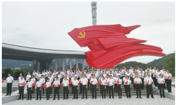
2021年7月，邮储银行三明市分行开展庆祝建党100周年系列活动。

“唱支山歌给党听，我把党来比母亲，母亲只生了我的身，党的光辉照我心……”2021年6月23日上午，微风徐徐，三明市红旗广场前，一群充满活力的邮储人手持红旗和鲜花，深情歌唱，激昂的红色歌曲回荡在空中。这是邮储银行三明市分行党委迎接建党100周年，开展“唱响红色旋律 厚植爱党情怀”快闪活动。现场120余名党员群众分成5个方阵，在7名歌手的带领下，从不同方向汇集到广场红旗雕塑下，满怀深情，放声高歌《唱支山歌给党听》。大家以朴实真挚的感情、铿锵有力的语调，唱出了对党的无限感激与深切热爱。这次活动只是邮储银行三明市分行在加强党组织建设，坚定永远跟党走决心和信心，推动三明市分行高质量发展凝聚力量的缩影。