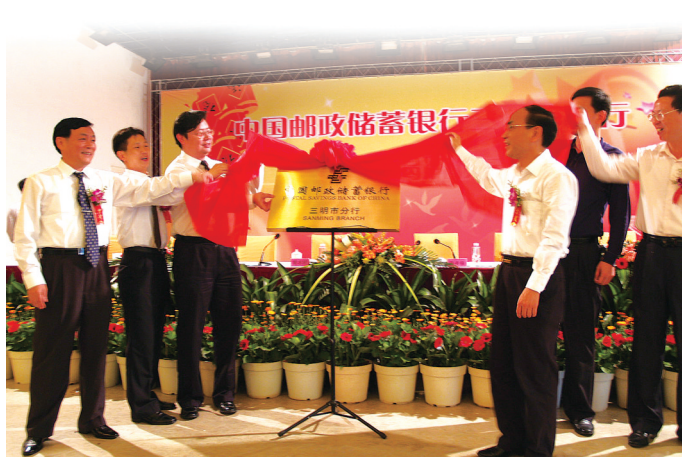
2008年4月18日，邮储银行三明市分行正式挂牌成立。

回溯过往，放眼未来，站在新的历史起点上的邮储银行三明市分行，更值得期待。邮储银行三明市分行将以学习贯彻党的二十大精神为统领，按照地方政府、监管机构的统一部署，践行国有大行的责任与担当，持续提升服务实体经济能力与质效，着力推进三明革命老区高质量发展示范区建设。