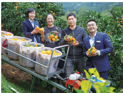
金融支持果农，助力乡村振兴。