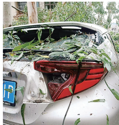
上河城小区一辆停在路边的轿车被倒下的树木砸坏后视镜。

（针对高空坠物的保险合同一般会作出以下相关规定：高空坠物事故导致第三者的人身伤亡或财产的直接损失，依法应由被保险人承担的经济赔偿责任，保险人按高空坠物保险合同的规定在赔偿限额内负责赔偿。）