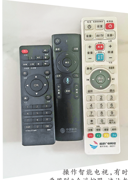
操作智能电视，有时要用到3个遥控器，这让老年人使用起来十分不便。

根据5月1日起施行的《互联网广告管理办法》第十七条规定，利用互联网发布、发送广告，不得影响用户正常使用网络，不得在搜索政务服务网站、网页、互联网应用程序、公众号等的结果中插入竞价排名广告。未经用户同意、请求或者用户明确表示拒绝的，不得向其交通工具、导航设备、智能家居等发送互联网广告，不得在用户发送的电子邮件或者互联网即时通讯信息中附加广告或者广告链接。此外，根据《中华人民共和国广告法(2018修正)》第四十四条规定：利用互联网发布、发送广告，不得影响用户正常使用网络。在互联网页面以弹出等形式发布的广告，应当显著标明关闭标志，确保一键