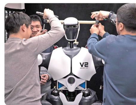
中国科学院自动化研究所人形机器人攻关团队科研人员在多模态人工智能系统国家重点实验室调试机器人。

“亚洲地区有着共克时艰的传统。”中日韩合作秘书处秘书长李熙燮表示,多年来,亚洲地区通过合作机制积累信任,也在