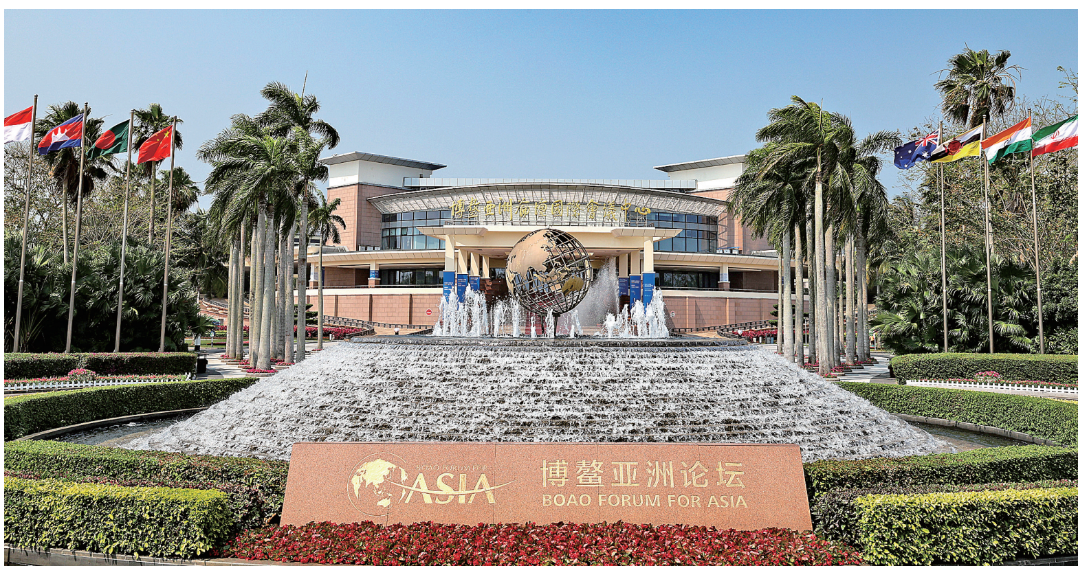
博鳌亚洲论坛国际会议中心。

此次博鳌亚洲论坛是自新冠疫情暴发以来首次举行的全线下年会。人们期待,论坛汇聚携手前行正能量,奏响和平、发展、合作、共赢的命运交响。