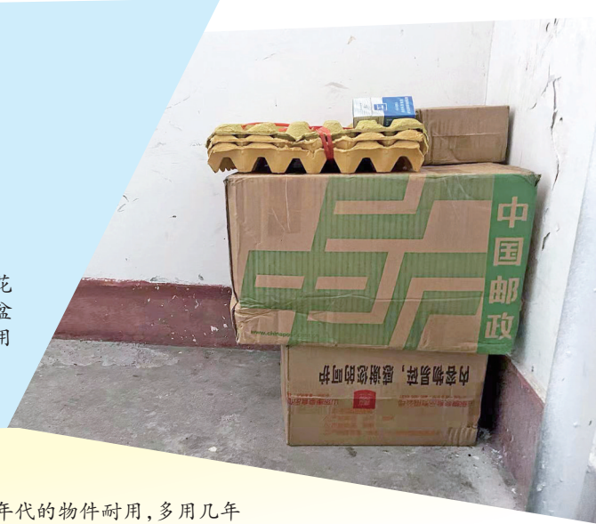
一户人家将收集的纸箱放在过道，存在火灾隐患。