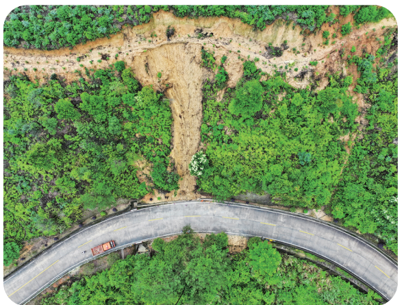
无人机准确观察隐患点