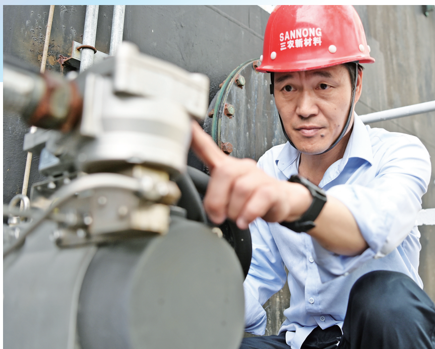
乐发灯检查设备安全