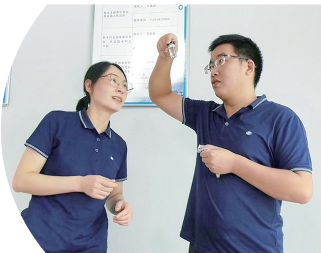
尤溪县水务公司工作人员定期到乡镇水厂检测水质。

如今,随着城东水厂一期二期工程、城西水厂扩容改造等项目相继建成,一条条供水大动脉使一城源头活水涌向千家万户。