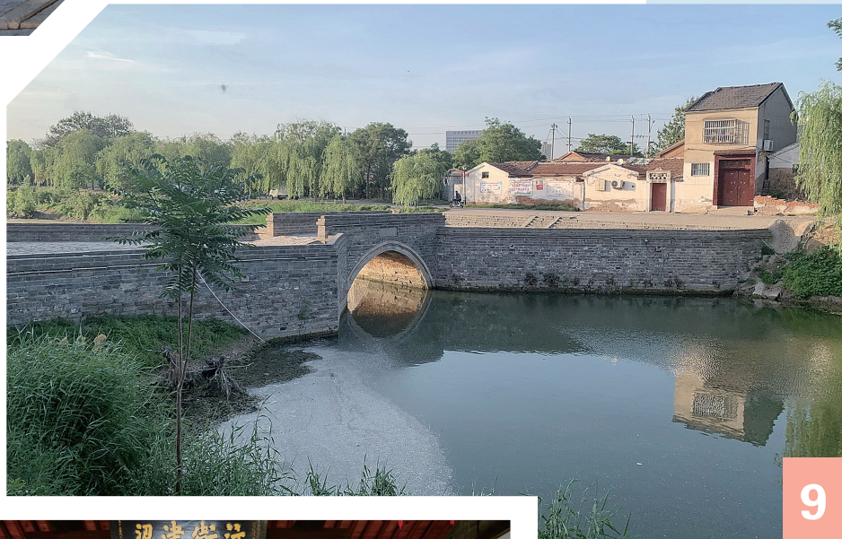
9 ▲ 古运河船闸:会通闸