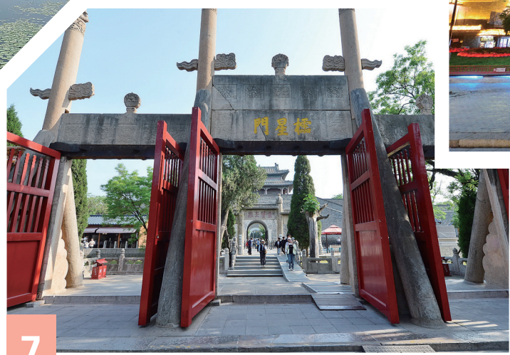
7 ▲ 山东曲阜孔庙棂星门