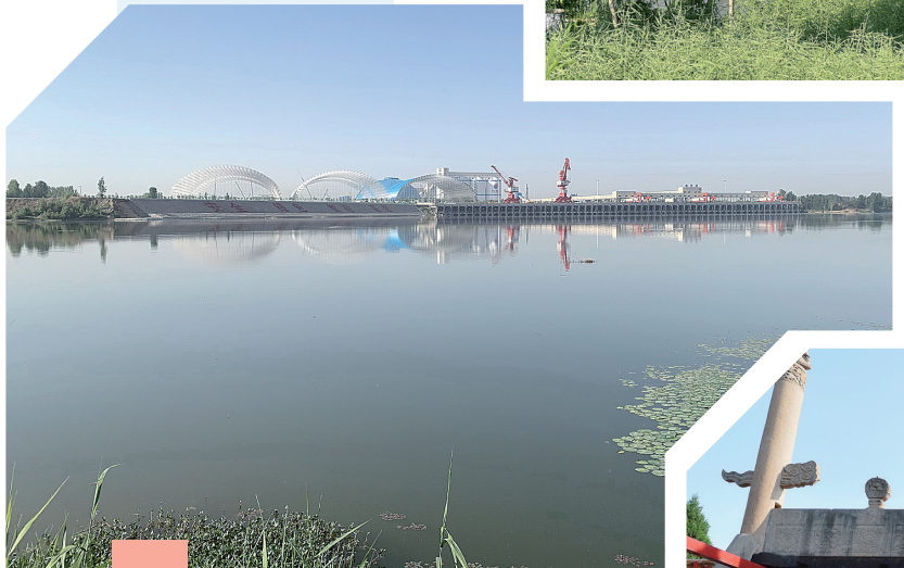
6 ▲ 微山湖,南北长120公里,宽约10~20公里,跨省连接山东济宁和江苏徐州地区,是京杭大运河天然水道,汇集大汶河等多条山东重要河流,形成我国北方第一大淡水湖。