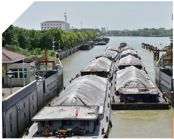
4 ▲ 江苏镇江,大运河与长江之间的谏壁船闸扩容工程正在施工中。大运河航道调整水位差当下均使用船闸,过闸、过长江需用托船牵引领航,繁忙时要等几小时甚至几天。