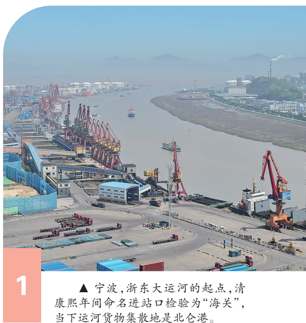
1 ▲ 宁波,浙东大运河的起点,清康熙年间命名进站口检验为“海关”,当下运河货物集散地是北仑港。

此次,我从三明驱车到宁波,开始旅拍大运河,直至山东临清,一路上饱览大运河风光,感受厚重的历史和人文底蕴。通过此次旅拍,笔者认为,大运河的文化内蕴、经济上的重要性是诸多世遗项目难以匹敌的。特别是中国大运河的开凿、通航管理等凝聚国人极高的智慧与科技,需要我们重新认识与思索。