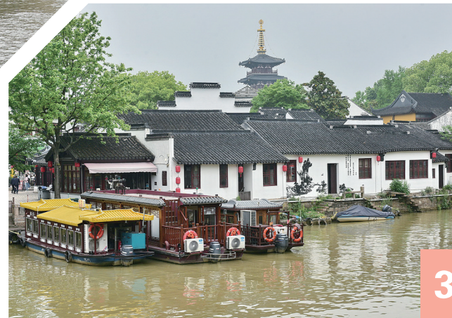
3 ▲ 江苏苏州,“姑苏城外寒山寺,夜半钟声到客船”。