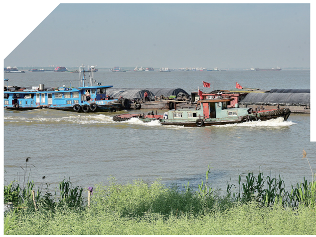
5 ▲ 过闸后的大运河船只、船队进入长江黄金水道。