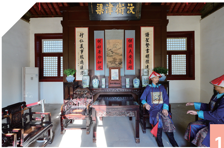
10 山东临清运河钞关

5月19日,第34次全国助残日,永安市残联、永安市仁爱社工中心联动福建水院、三明二院、永安公交公司,以及爱心企业等多方资源助残出游,带领38位残疾人去参观永安市抗战文化遗址——燕西街道上吉山村,并在村里的国立音专旧址门前倾听红色故事,以及残疾人讲述学电商做电商的经历。随后,残疾人表演了轮椅舞蹈、歌曲演唱、诗歌朗诵、二胡独奏等丰富多彩的节目。