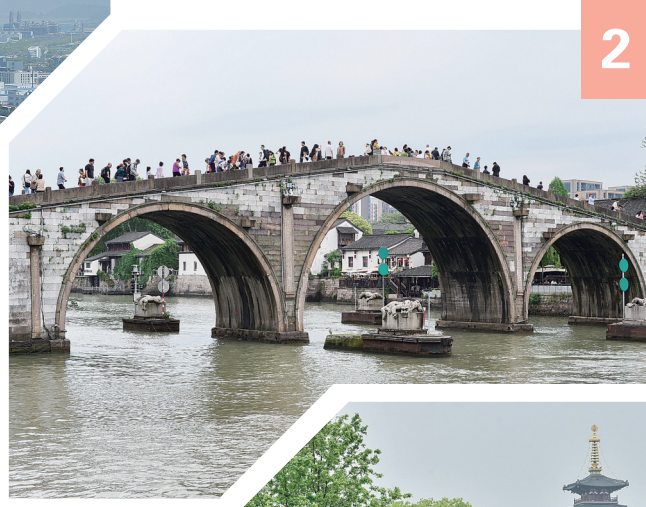
2 ▲ 浙东大运河,从宁波经余姚、绍兴达杭州,过钱塘江与京杭大运河对接,这是始建于1613年的杭州拱宸桥,为京杭大运河起点。