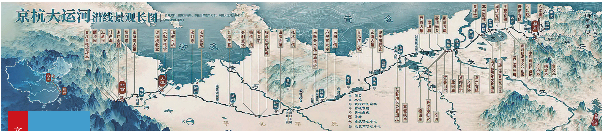
京杭大运河沿线景观长图