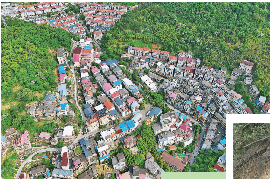
▲城东村绿化美化工作 ▲宋钰莹(右一)与同事在造林山场观察无患子生长情况