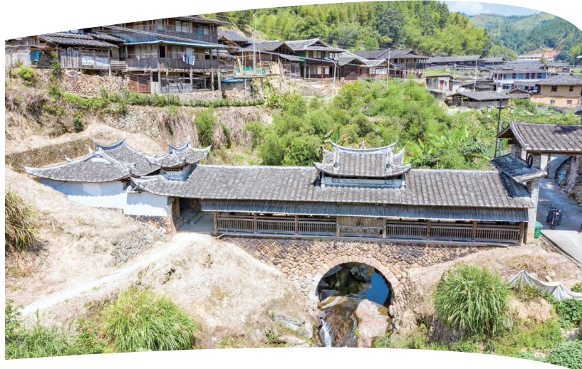
◀新坑水尾桥 (黄在锦 摄) ▼新坑村 (黄在锦 摄)