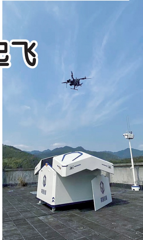
沙县区富口镇智能机场无人机起飞

同福建生态工贸区生态新城集团有限公司合作,完成三明生态新城倾斜摄影测量测绘项目,提供无人机倾斜摄影测量