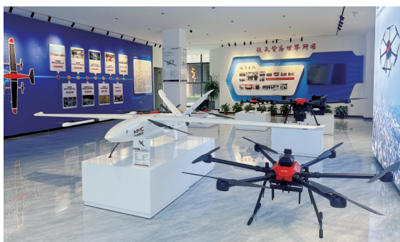
科比特航空助力我市低空经济

24小时全天候作业,23米每秒飞行速度,20公里飞行半径,7级以下风力正常工作,4块可自动更换的电池组……各项过硬的参数让科比特无人机可以适应应急管理、公安、林业、水利、交通和自然资源等各个应用场景的需求,所有操作可通过无人机远程调度平台完成。