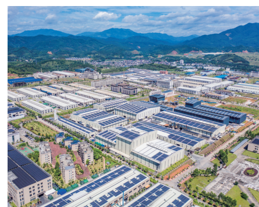
永安市石墨和石墨烯产业园

这40年我们追求美好、接续奋斗,用我们的团结基因开创了一座生活宜居之城。 围绕“一老一幼”需求短板,“一大一小”教育质量,“一快一慢”出行系统,永安问需于民,施策为民,绘就宜居宜业和美画卷。从学有所教到学有优教。永安不断加大教育基础设施投入,优化城乡教育资源配置,深化教育综合改革,仅近10年来,永安就实施教育建设项目29个,投入经费近7亿元,城乡办学条件和教育教学质量持续改善提升。从病有所医到病有良医。永安整合组建三明市永安总医院,推进市、县、乡、村四级医疗机构的紧密型医共体建设,完善分级诊疗体系,同时,被列入省级区域医疗中心建设范围,城乡医疗服务能力不断提升。从老有所养到老有所颐养。永安着力构建多元化的社会养老保障体系,建成农村区域养老服务中心2个、社区嵌入式养老机构2个、日间照料中心6个、农村幸福院54个、长者食堂(含助餐点)21个。从有路可行到路路畅行。永安推动实施一批批交通民生工程,实现“城市有动车、连县通高速、镇镇有干线、村村通客车”的美好愿景,成为闽中重要的交通枢纽。既有“快通道”又有“慢行圈”,永安加快慢道建设,打造燕江、巴溪、后溪“一江两溪”景观生态长廊,一个富有山水特色、“300米见绿,500米见园”的城市园林绿化格局基本形成。