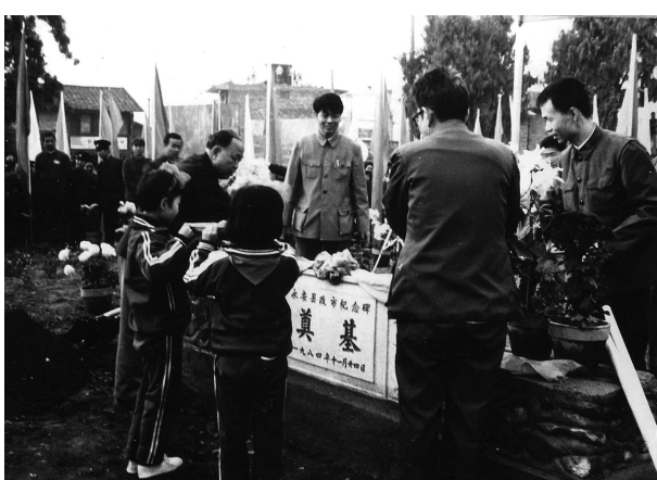
◀1984年11月24日,永安举行市碑奠基仪式。