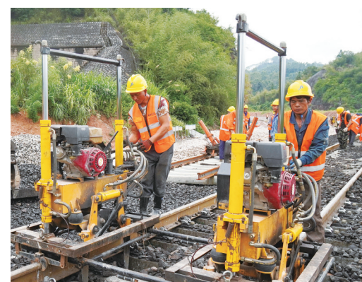
永安市闽中公铁联运物流基地铁路港项目建设现场