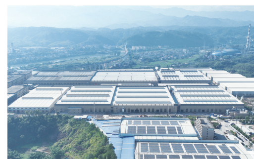
建新轮胎项目