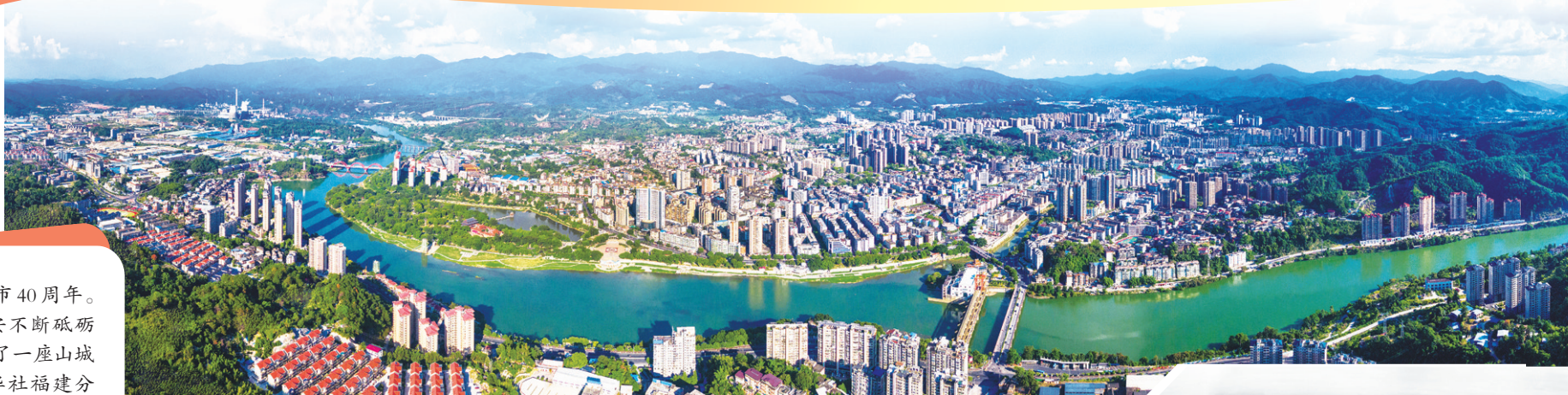
◀永安城区今昔对比图

今年是永安撤县设市40周年。40年的历程,记载着永安不断砥砺奋进的闪光足迹,“建”证了一座山城的锦绣繁华。近日,新华社福建分社、中新社福建分社、福建日报社、东南网记者围绕“撤县设市”这一主题,对永安市委书记傅天宝作了专访,以下是永安市融媒体中心整理的采访内容。