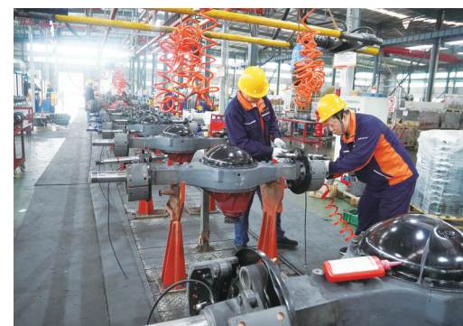
在福建海工车桥制造有限公司车间内,工人们正在赶制订单。