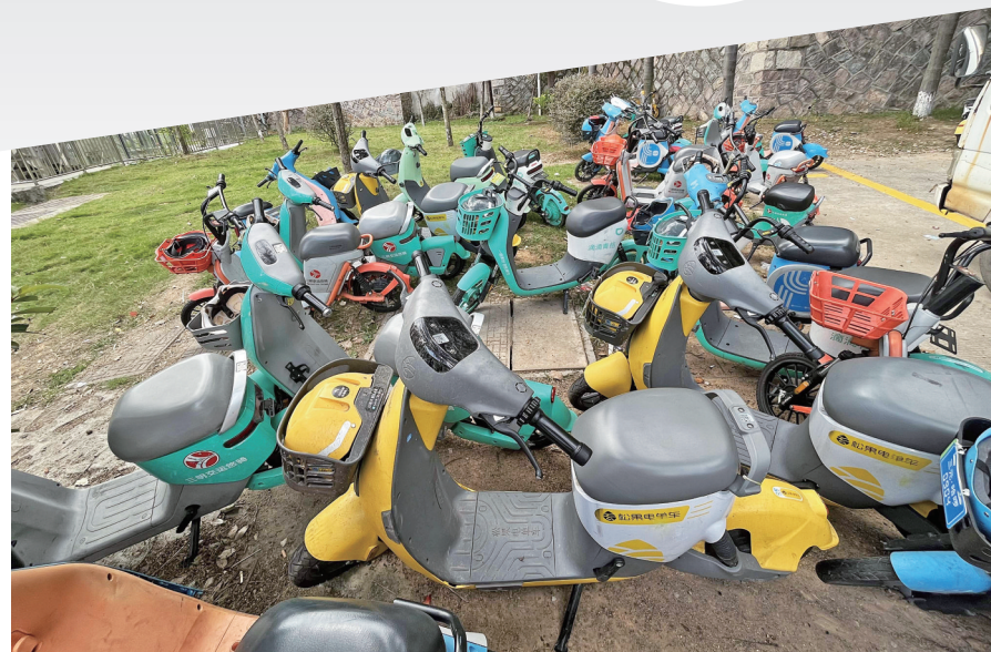
层层堆放的共享电动单车

用户购买保险,并为车辆配备骑行头盔,在使用过程中推行人脸识别,对骑行账号使用实行实名制管理,禁止向未满16周岁的未成年人提供共享电动单车租赁服务。