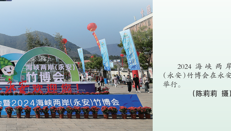
2024 海峡两岸(永安)竹博会在永安举行。