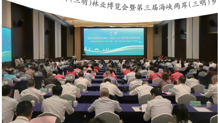
第三届海峡两岸(三明)乡村融合发展论坛举行。