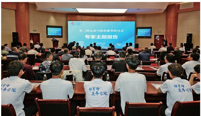
第三届运动与森林康养研讨会召开。