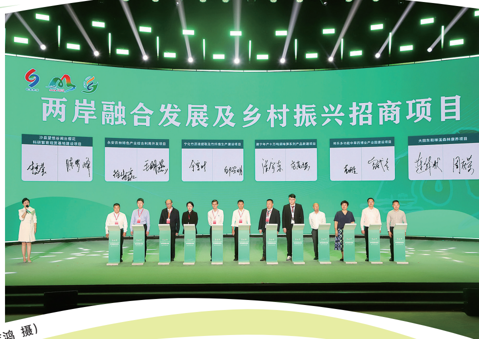
在竹木产业链暨明台现代农业产业融合发展专场招商活动上,一批项目成功签约。