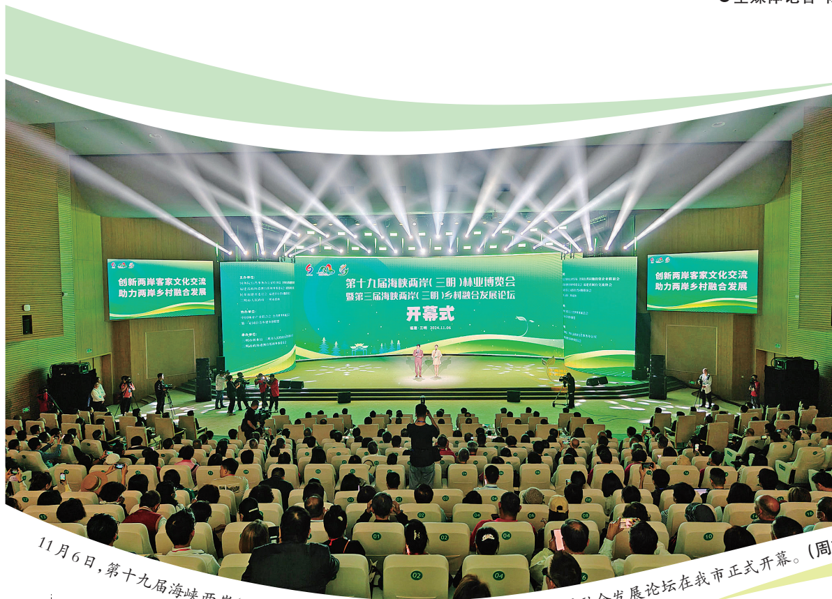
11月6日,第十九届海峡两岸(三明)林业博览会暨第三届海峡两岸(三明)乡村融合发展论坛在我市正式开幕。