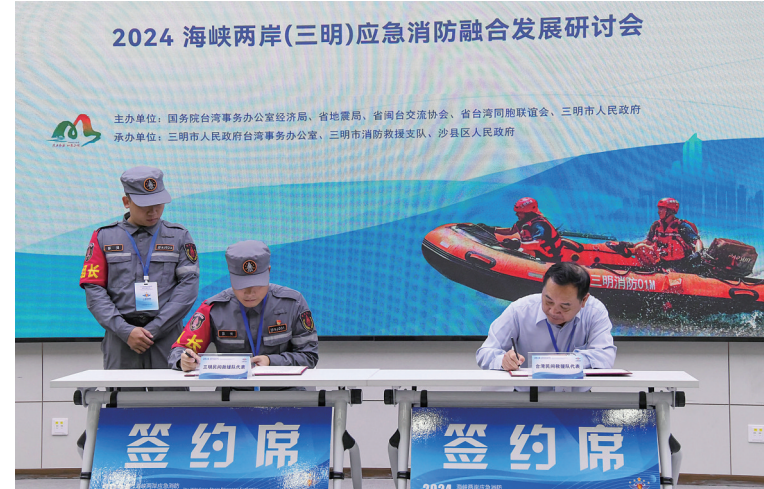
2024 海峡两岸(三明)应急消防技术交流研讨会举行。