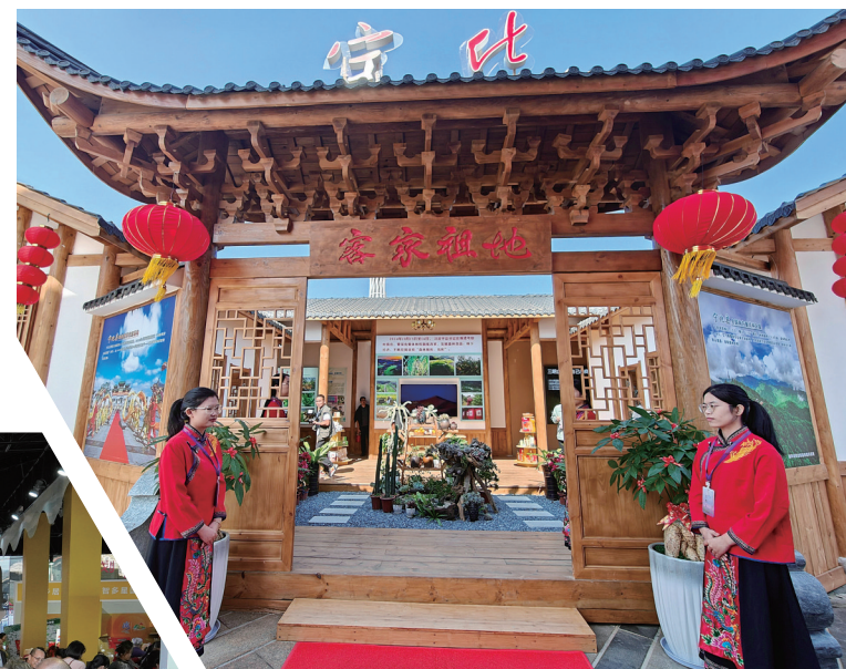
县(市、区)展馆突出地域特色。(周志鸿 摄)