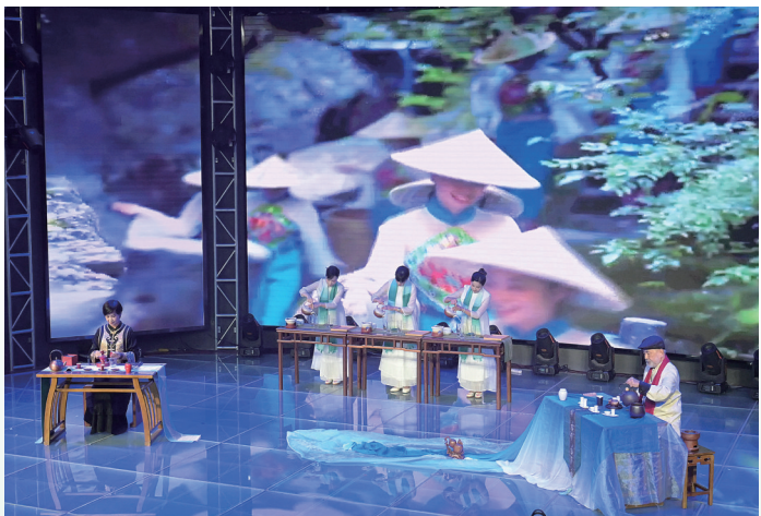
明台“三雅道”传统文化交流活动

初冬的三明,三角梅相拥成簇,生态美景尽收眼底。11月6日至10日,第十九届海峡两岸(三明)林业博览会暨第三届海峡两岸(三明)乡村融合发展论坛在三明举行,致力“两山”转化,聚力两岸融合,为参会者带来一场集林业改革创新、两岸融合发展与绿色生态建设于一体的精彩盛宴。