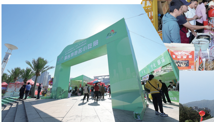
第十九届林博会明台特色小吃展