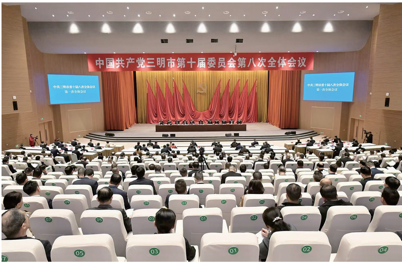
十二月十一日,中共三明市委十届八次全会举行。

全会充分肯定今年以来市委常委会的工作。一致认为,市委常委会坚持以习近平新时代中国特色社会主义思想为指导,全面贯彻党的二十大精神,深入学习贯彻习近平总书记在福建考察时的重要讲话精神,强化政治引领,高站位落实重要嘱托,抓牢第一要务,高质量推动经济发展;突出生态优先,高标准建设美丽三明;弘扬创新精神,高效能深化特色改革;发挥政策优势,高水平扩大开放合作;厚植为民情怀,高品质改善民生福祉;坚持党的领导,高标准从严治党,深化拓展“深学争优、敢为争先、实干争效”行动,推动“红色领航、