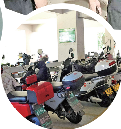
▲相关部门联合开展电动自行车夜查行动 (受访者供图) ▲小区架空层内不少电动自行车正在使用充电桩充电