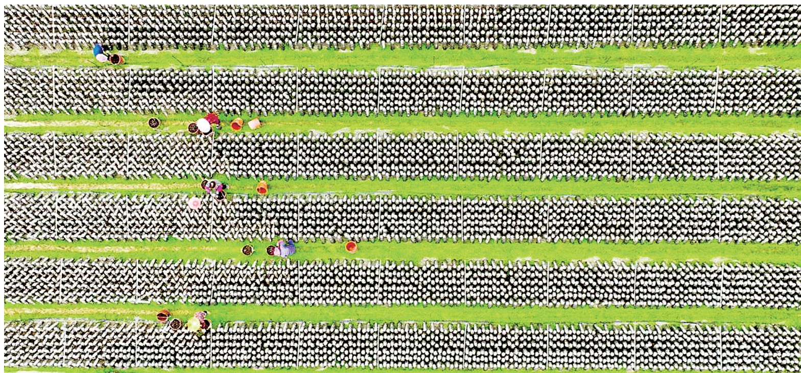
后楼村村民在采收黑木耳

“3.5亿元!”在尤溪县洋中镇后楼村食用菌养殖大棚前,村党总支书记林城的语气带着骄傲,“这只是村民在后楼村信用社的存款,不包括存在别处的。”后楼村的“民富”,靠的是村里“一黑一白”的富民产业——黑木耳、香菇为主的“一黑”,银耳、绣球菌为主的“一白”。5月27日举行的全省深入学习“千万工程”经验推进乡村全面振兴现场会强调,要坚持以县域为重点,统筹城乡规划布局;要做好“土特产”文章,精准培育乡村富民特色产业。这为后楼村的进一步发展增添了动力。