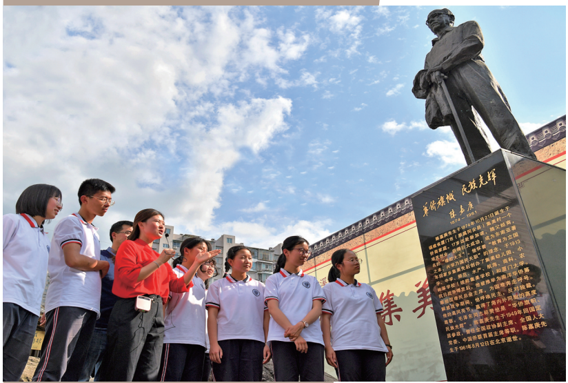
各地来访学生在大田“第二集美学校”旧址聆听陈嘉庚事迹,深化爱国主义教育。