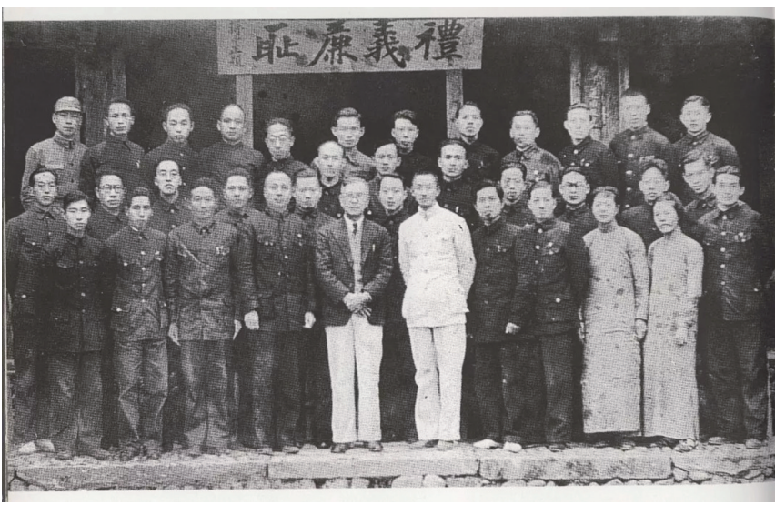
1940年11月14日,陈嘉庚到大田县视察集美联合职业学校时与部分教师合影。