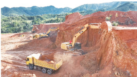
尤溪经济开发区城南园三期项目