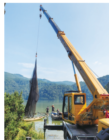
清理紫阳湖沉网