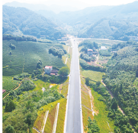
沙厦高速尤溪西互通及接线工程新铺设的路面