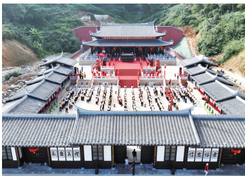
朱子文化园二期

秀村服务区B区出入口工程,9月30日正式通车运营,提前完成攻坚任务;尤溪县中坂线吉华至中仙段公路灾后恢复重建工程,完成路基工程80%、涵洞18道……尤溪9个重大基础设施“百日攻坚”项目总投资1.81亿元,截至10月31日,完成投资1.14亿元,占攻坚计划投资的62.8%。