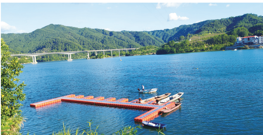
风光旖旎的紫阳湖