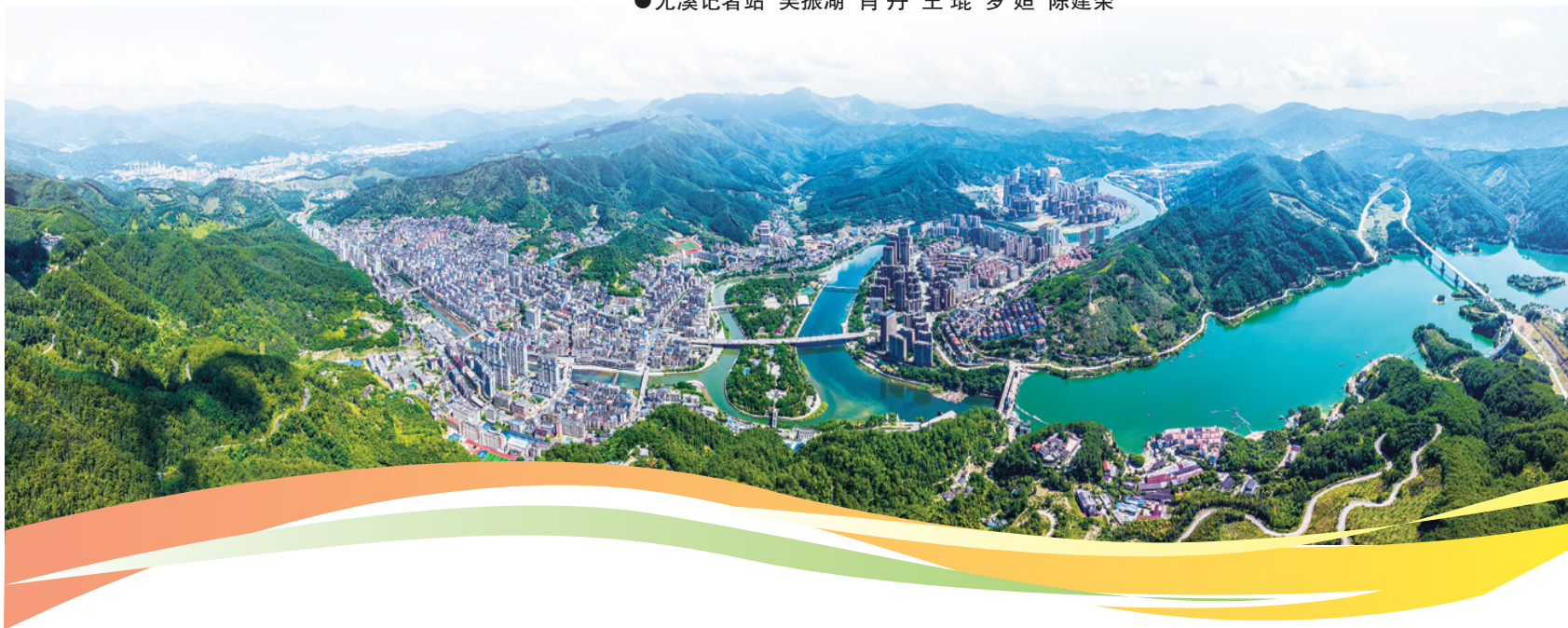
尤溪县城航拍图