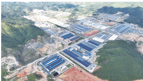
尤溪经济开发区城南园