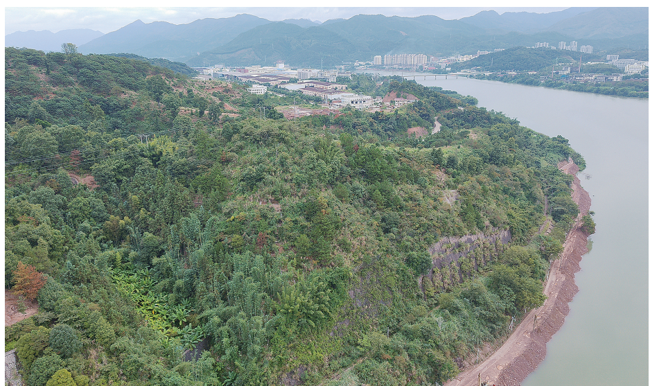
古铜场遗址位于沙县区古县村以西的高山岩山坳里。

沙县区古县村曾经是沙县原县治——沙村县的治府所在地,距今已有1600多年的历史。相传早在春秋战国时期,这里就有古代劳动人民活动的遗迹,沙县先民(闽越族人)在此采矿炼铜,创造了闽中的文明与辉煌。