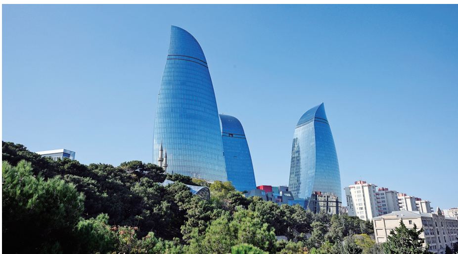
这是11月1日拍摄的阿塞拜疆巴库地标建筑之一——“火焰塔”。