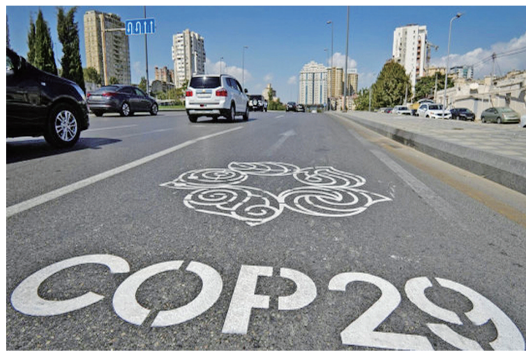
这是11月1日在阿塞拜疆巴库拍摄的《联合国气候变化框架公约》第二十九次缔约方大会专用车道。

近期,越来越多的中国企业赴阿塞拜疆考察,探索储能、海上风电等新能源项目的合作前景。这不仅将为阿带来先进技术和设备,带动当地就业和相关产业发展,还将助力阿实现相关的绿色能源战略目标。(新华社巴库11月10日电)