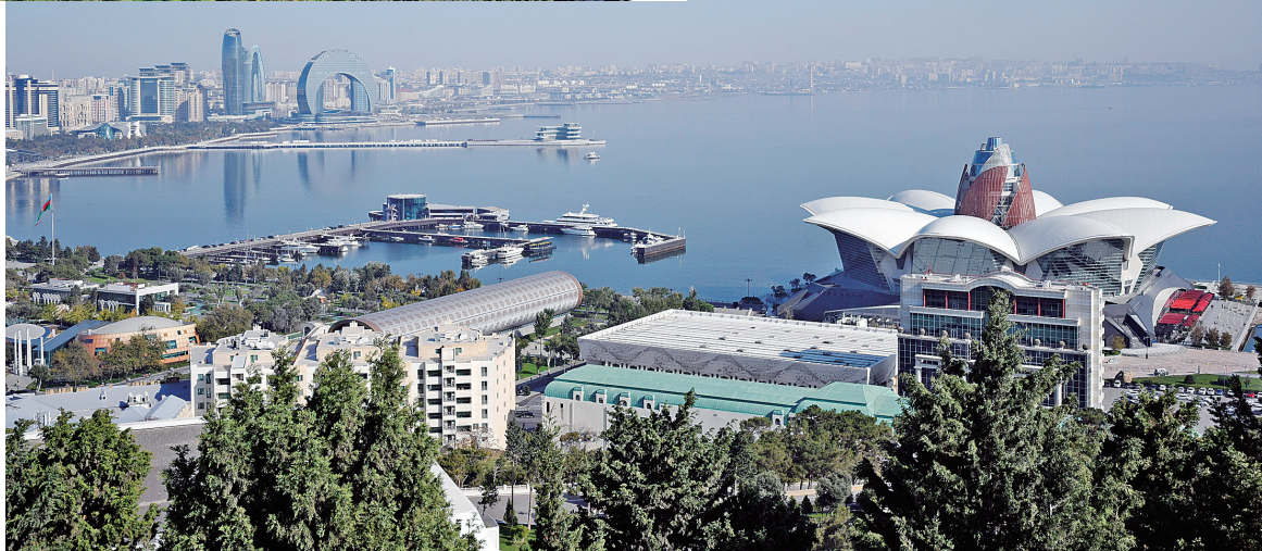
这是11月1日拍摄的阿塞拜疆巴库城市风光。