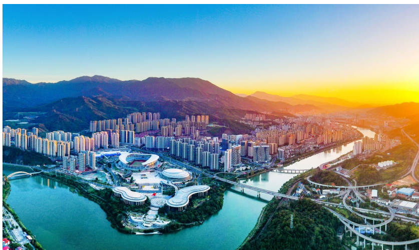
如今美丽的三明城一隅